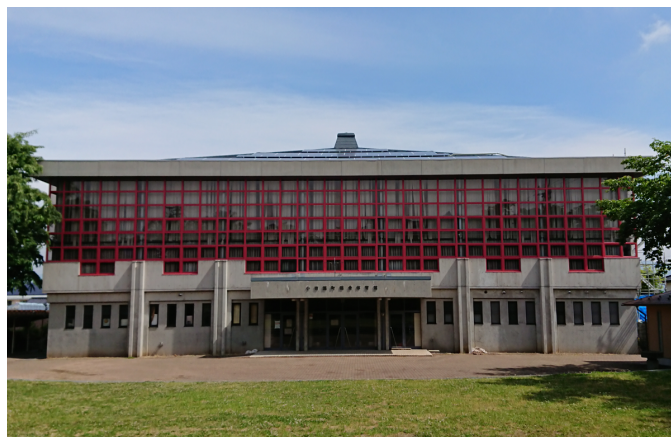
小布施町総合体育館