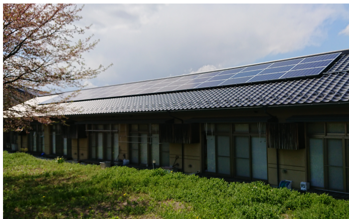
小布施町生活支援ハウス

ながの電力は今後とも自然エネルギー*1を軸としてエネルギーの地産地消やレジリエンス向上に寄与するサービスを生み出し地域に貢献する事業を行ってまいります。