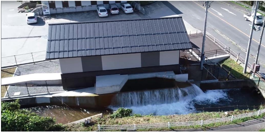
【小布施松川小水力発電所 水車外観（上）、建屋外観（下）】